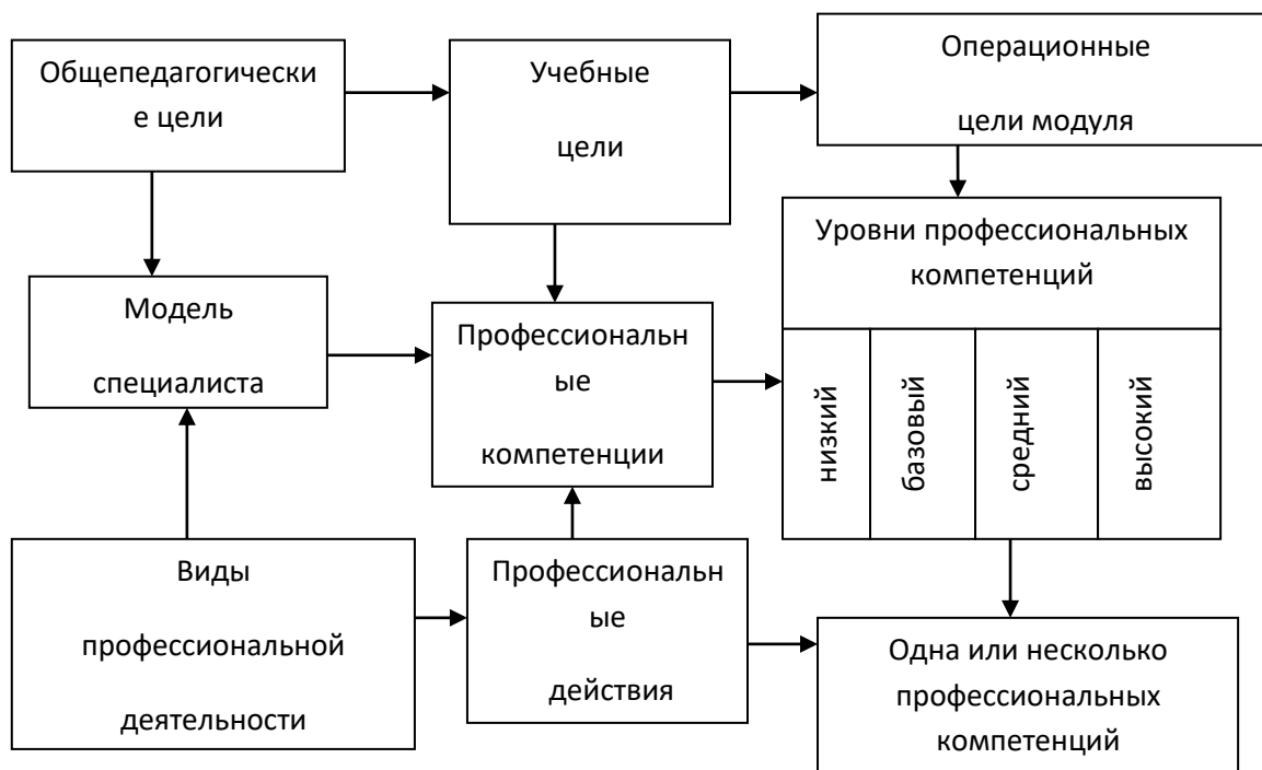
Рисунок 1. Выявление уровня формирования компетенций

В основу каждого из уровней положены понятия познавательной деятельности: воспроизведение, понимание, применение, анализ, синтез, оценка (рисунок 3).